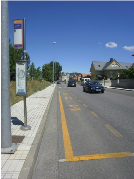
Imagen zona punto negro (glorieta de AV. Galicia):

Parada de bus más cercana (pero fuera del polígono):