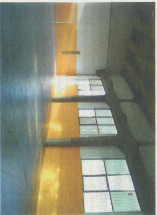
I LOCALI DELLA PALESTRA RISTRUTTURATA