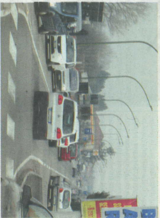
IN CORSO ALESSANDRIA IL TRAFFICO DI AUTO È UNA NOTA DOLENTE (FOTO AGO)

Il progetto Mo. Ma. Biz, voluto per studiare le problematiche della viabilità nelle zone industriali di 6 diverse città europee, tra cui Asti, ha prodotto i primi risultati. L'indagine non è ancora terminata ma, per quanto riguarda la zona industriale di corso Alessandria, sono emerse numerose criticità segnalate direttamente da chi, nella stessa, ci lavora quotidianamente. Il 77% dei lavoratori intervistati afferma di usare la propria auto per recarsi al lavoro e di percorrere meno di 7 km nel tragitto casa-azienda. Non solo. Gli stessi segnalano di trovare sempre molto traffico, cosa che non aiuta a raggiungere velocemente il luogo di lavoro. Secondo Comune e Provincia, che sono direttamente coinvolti nel progetto Mo. Ma. Biz insieme all'Asp, sindacati, titolari di aziende e lavoratori, usare la bici o i mezzi pubblici per raggiungere l'area industriale di corso Alessandria potrebbe essere una valida alternativa. Il problema nasce, però, da quanto emerge nella seconda parte del questionario, quella relativa al trasporto pub-