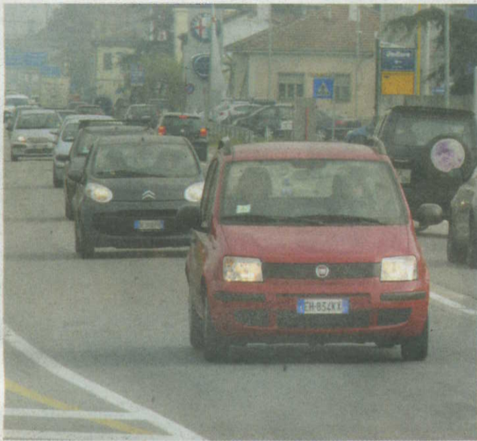
UN TRAFFICATISSIMO CORSO ALESSANDRIA