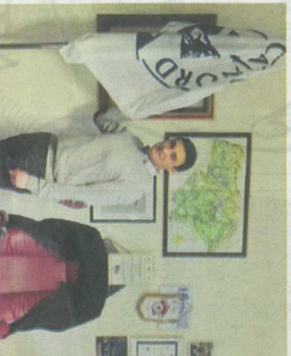
IL VICE PRESIDENTE MOSTRA LA BANDIERA PADANA

«Invitiamo il vice presidente a rassegnare le dimissioni dal suo incarico, incompatibile, a quanto pare, con i suoi valori padani» si legge in un comunicato stampa. «Un atto di gravità inaudita - aggiungono quelli di Fld - uno sfregio verso i cittadini astigiani e italiani. Non è concepibile che una persona che ricopre tale incarico, peraltro remunerato dal popolo italiano e non padano, si renda protagonista di un gesto così lesivo